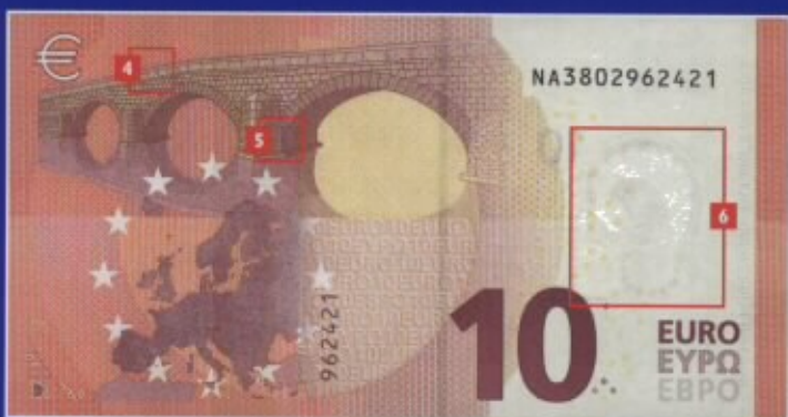
Verso da nova nota de €10

Para mais informações sobre as notas e moedas de euro, contacte o seu banco central nacional ou o Banco Central Europeu.