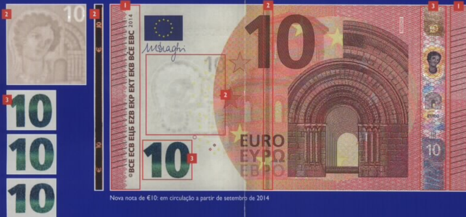
Nova nota de €10: em circulação a partir de setembro de 2014