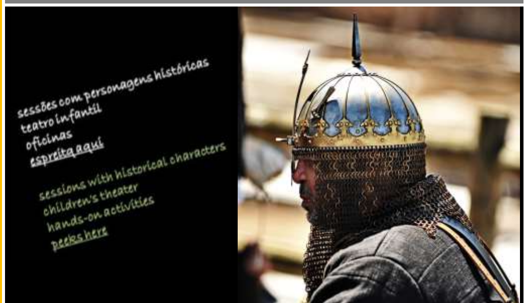
Figurino: mouro, sec. VIII. Costumes: moor, century VIII.

O Lisboa Story Centre vai estar na FEAL - 9 junho The Lisboa Story Centre will be in the FEAL - June 9